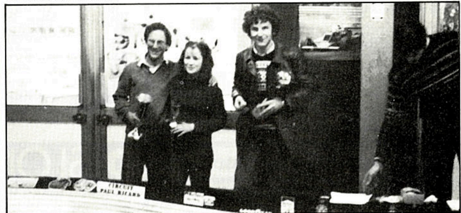
L'équipe victorieuse de Bordeaux.

Ferrari de Marmande qui change d'induit et la Renault dont le châssis fut vrillé lors d'un choc rendant la voiture inconduisible.